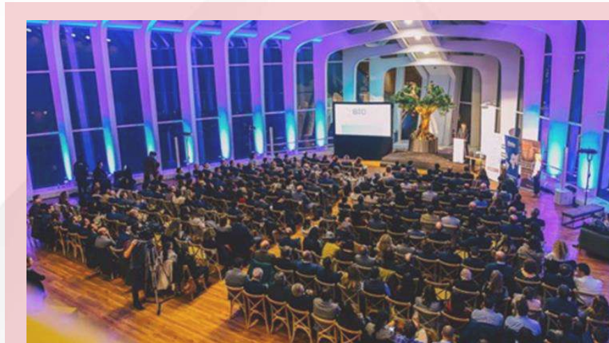
Noche de la BIO 2018 Palau de les Arts Reina Sofia